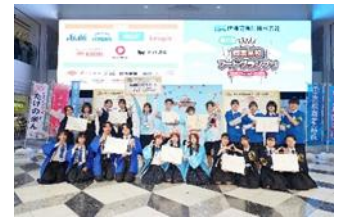
第11回商業高校フードグランプリの様子

会場：池袋・サンシャインシティ 噴水広場(アルパB1) ※入場無料 〒170-8630 東京都豊島区東池袋 3-1